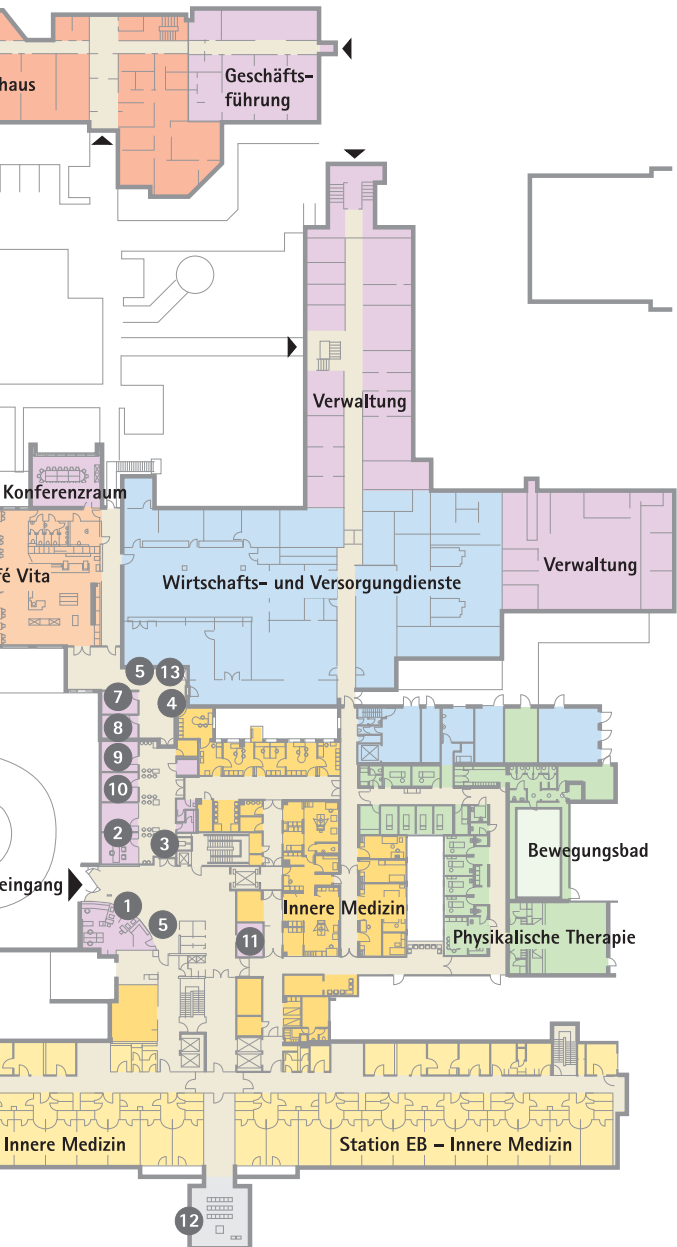
Parkanlage des St. Antonius-Hospitals